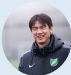
洪明甫 小赛虎首席顾问 韩国足协副主席，前韩国队主教练、杭州绿城主教练